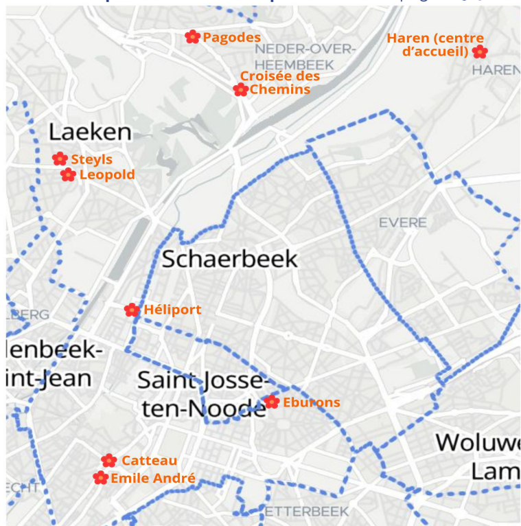
Carte des plaines de Printemps (voir détail en pages 29-30)

Chaque journée sera une nouvelle mission : résoudre des défis, fabriquer des inventions, rencontrer des personnages du futur et découvrir ce que pourrait devenir notre ville si c'était nous qui la transformions.